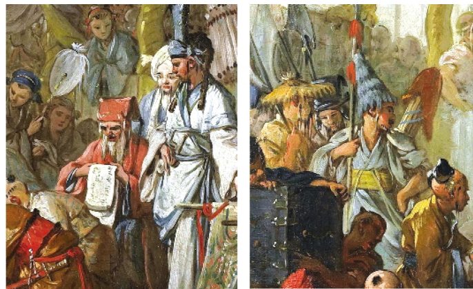
中国皇帝上朝(局部)