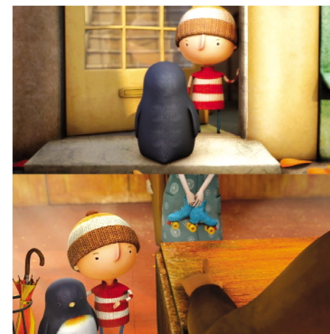
《远在天边》影片画面