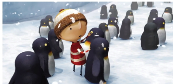
《远在天边》影片画面

短片《远在天边》是一个围绕着寻觅与旅途的童话,讲述了一个温暖有爱的小故事,治愈了无数观众的心灵创伤。一个小男孩、一只小企鹅,他们来自世界的两端。因为一场旅途,一个开始,就有了一段美好而珍贵的友谊。