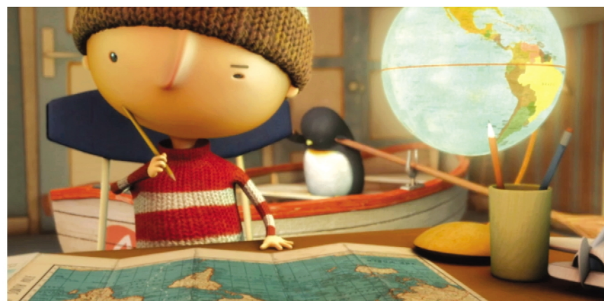
《远在天边》影片画面

小男孩翻阅资料后,制作了小木船,和小企鹅一同踏上前往遥远南极的归乡旅途。然而,小男孩从来没有想过,这个“不速之客”会成为自己亲密无间的好朋友。